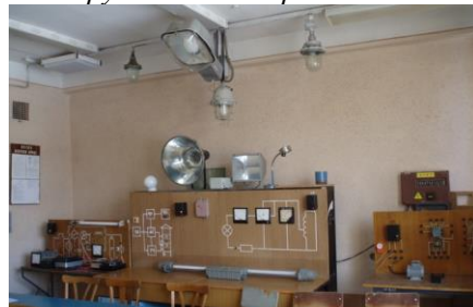
Лабораторія електросилових та електроосвітлювальних установок