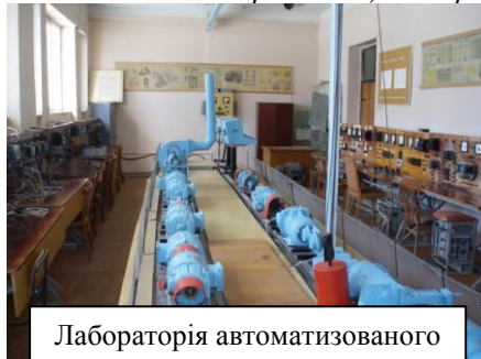
Лабораторія автоматизованого електроприводу