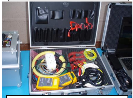
Сучасне обладнання для виконання лабораторних робіт