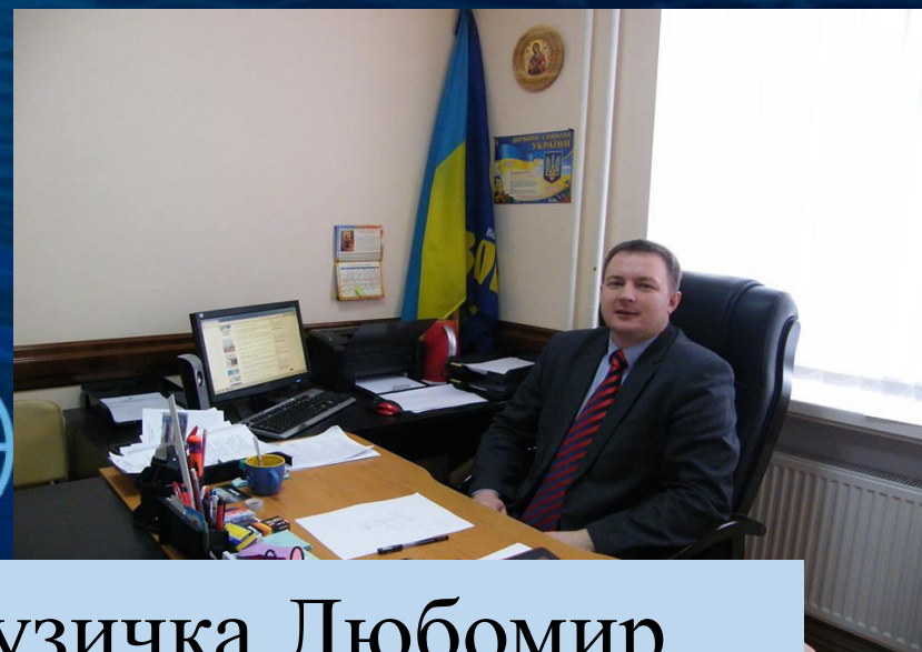
Музичка Любомир Міський голова м. Городенка