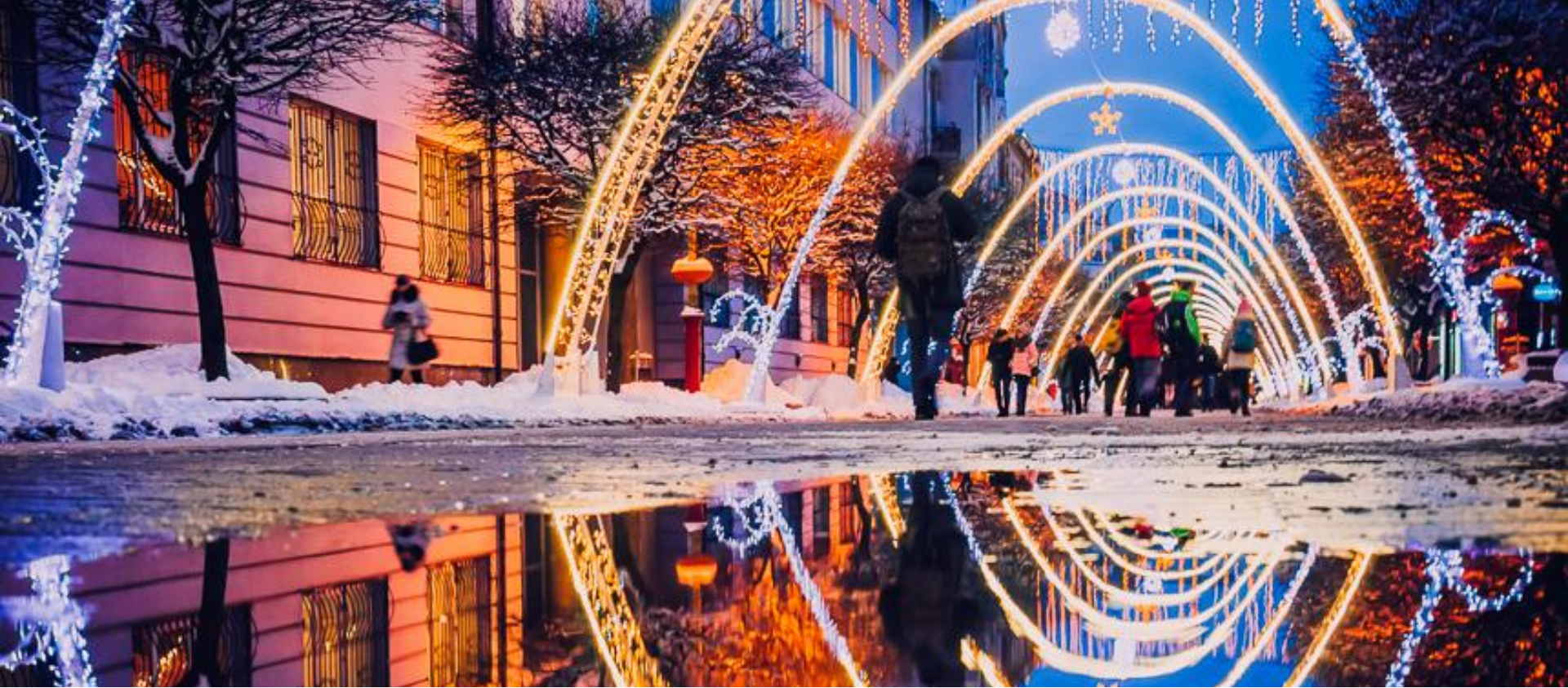
СВІТЛОДІОДНІ АРКИ НА СТОМЕТРІВЦІ Місцезнаходження: Україна, Івано-Франківськ 2017 46 однакових арок зі світлодіодною ілюмінацією