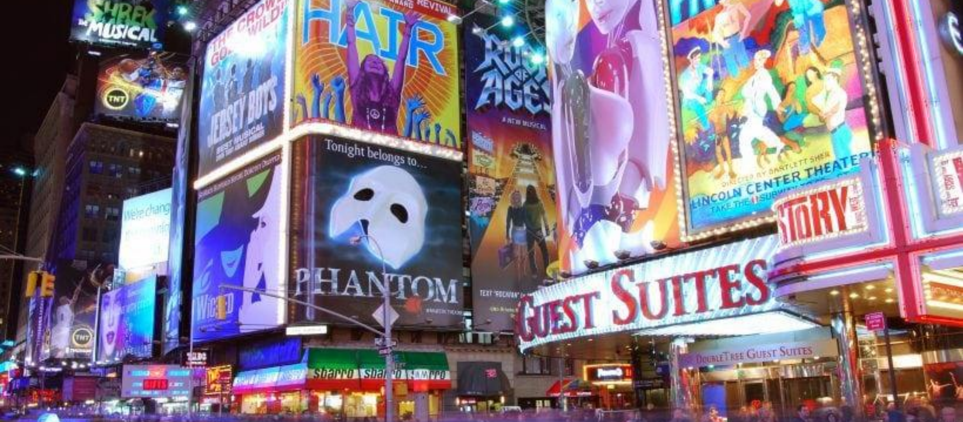
Синонім екстравагантної культури Америки, Таймс Сквер пропонує безліч унікальних варіантів для великих і малих брендів